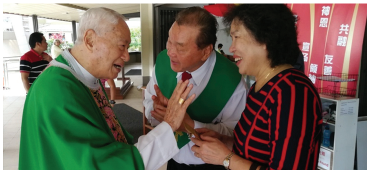
● 耄耋之年荣休钟总主教仍热诚于牧灵工作，牧养主的羊群，为教友服务。

我的日常生活也包括大部分在书桌和电脑上的时间（当然不是搜索无用的娱乐），阅读书本，接待到访的人们。