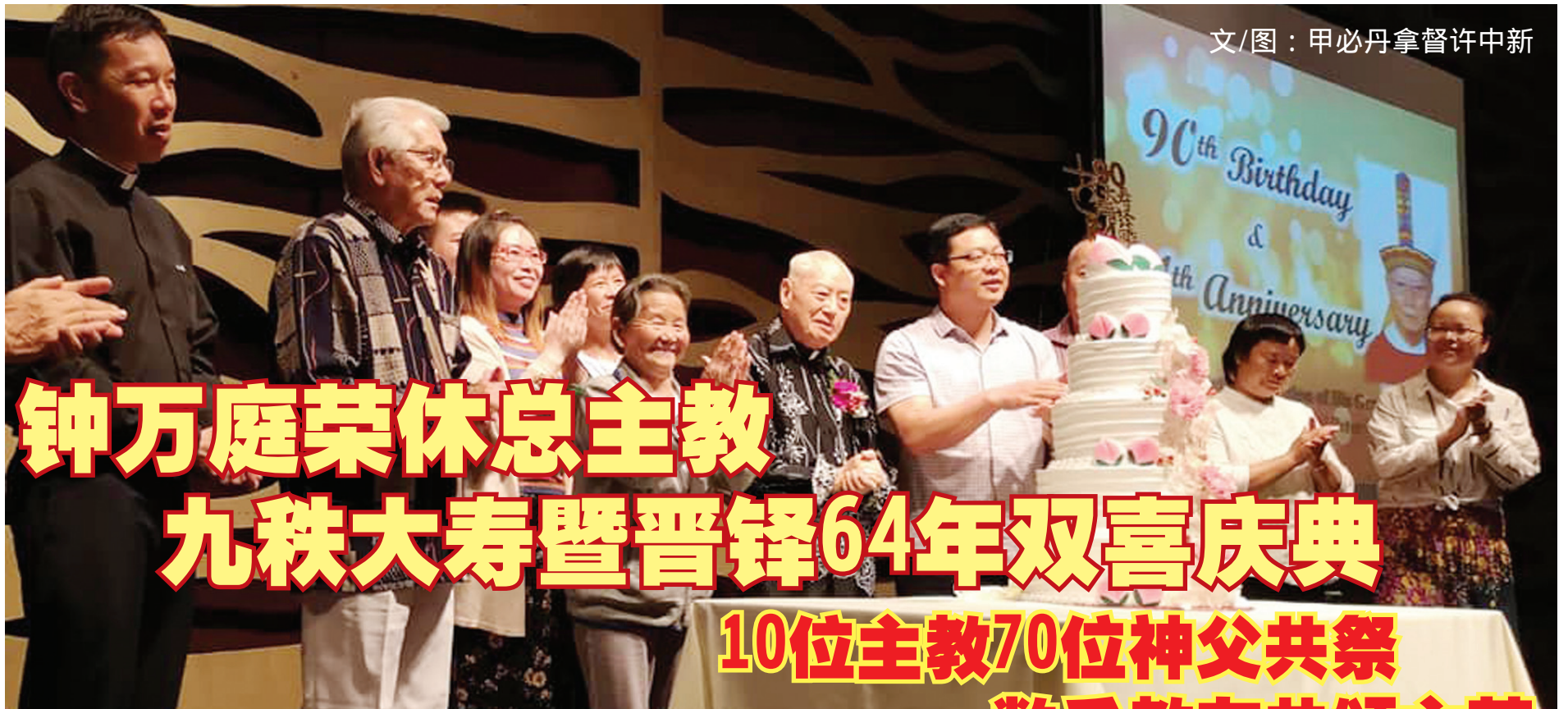
文/图：甲必丹拿督许中新